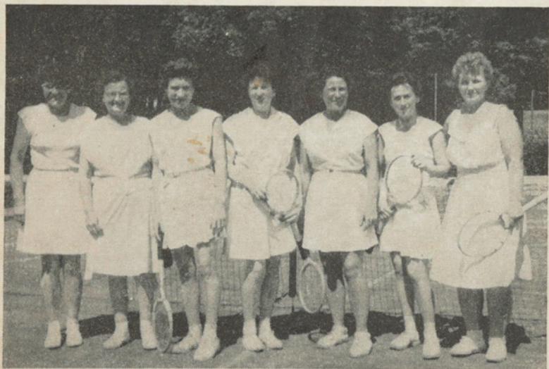
Die 1. Damenmannschaft der SG Grün-Weiß Baumschulenweg stieg zur DDR-Liga auf