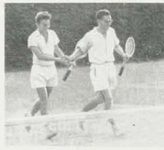
Das Überraschungspaar Brause/Martin

◀ Unser Titelbild: Der deutsche Meister Stahlberg zeigte am Volkssporttag der ägyptischen Sportstudentin Nagan Motawi die „Geheimnisse“ des Tennis.