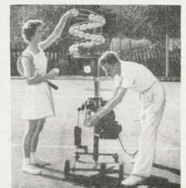
Der Trainer der englischen Tennisschule von Essex „ladet“ mit seiner Frau die neueste Ballmaschine Australiens auf