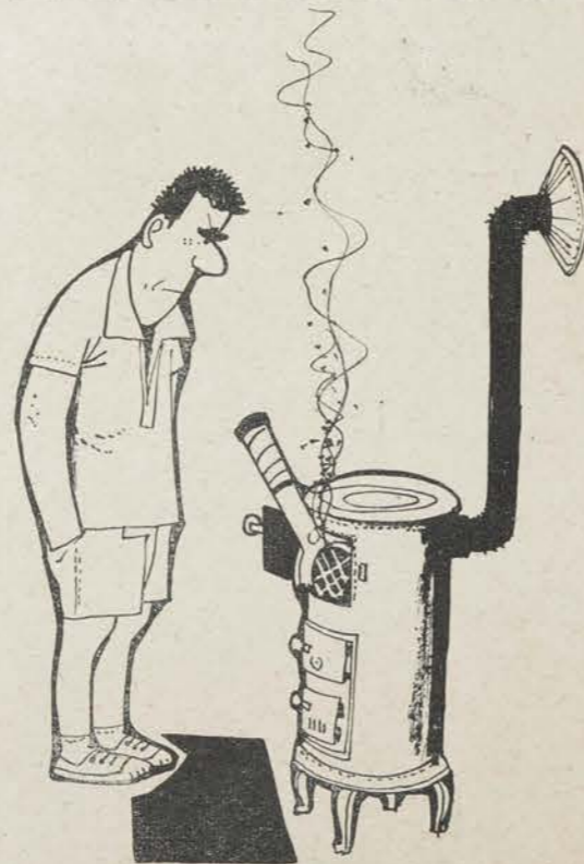
Punkt 18 aus der „Tennis-Fibel“. Ziehe Lehren aus Erfolgen und Niederlagen!