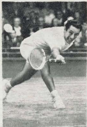
Das ist der Mann mit dem wunderbaren Ballgefühl — Weltranglistenspieler Luis Ayala aus Chile.

Regen machte einen Strich durch die Rechnung der Nationalen Meisterschaften von Österreich in Wien. Eine wahre Sintflut machte die Fortsetzung der Finalkämpfe auf einen späteren Termin not-