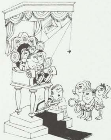
„Ich finde, unsere ‚Asse‘ sitzen lange genug auf ihrem Thron!“