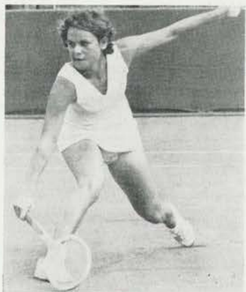
Von der 17jährigen Evonne Goolagong, die einen nicht geringen Anteil am Gewinn des Fédération Cup hat, erwartet das australische Tennis noch sehr viel.