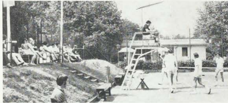
Erinnerung an Lauchhammer, das sich durch seine Turniere für die Bergarbeiterjugend einen guten Namen erworben hat.