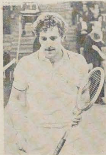
Jan Kodes, seit einiger Zeit mit einem Bärtchen dekoriert, gehört seit zwei Jahren zur absoluten Weltspitze.