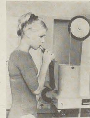
Untersuchung mit einem Spirotest-Gerät zur Bestimmung der Atemfunktion.

lastung (im Sitzen) = P_3 je 10 Sekunden lang gefühlt.