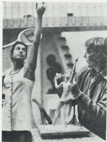
Virginia Wade, Englands erfolgreichste Spielerin der letzten zwei Jahre, wird vom britischen Bildhauer David Wynne modelliert. Als Motiv wurde nicht zufällig ihr Aufschlag gewählt, gilt doch Virginia Wade als Tennisspielerin mit dem besten Service.

Die australischen Hartplatzmeisterschaften in