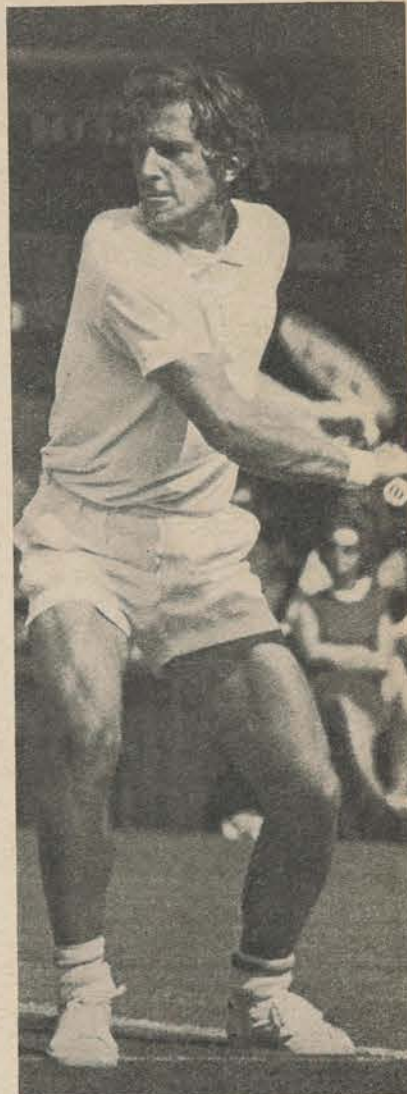
Wird Jan Kodes in diesem Jahr seine CSSR-Mannschaft in die Challenge round führen? Die Chancen stehen nicht schlecht.