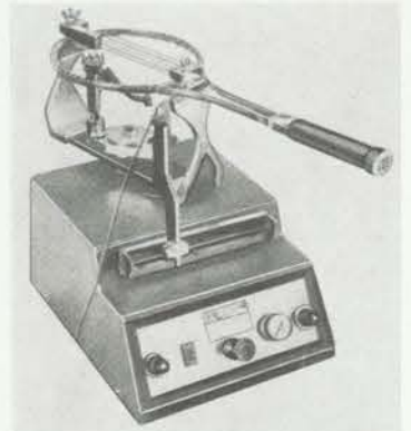
Eine moderne Besaitungsmaschine, die mittels hydraulischem System die Tennisschläger sowohl mit Darmsaiten als auch mit Kunstsaiten in der jeweils gewünschten Härte bespannen. Diese Electro-Matic-Maschine gilt als eines der international bewährtesten Modelle.

Vielen Tennisspielern ist nicht bekannt, daß man Schafdarm nicht gleich Schafdarm setzen kann. Die Qualität der Därme für die Herstellung von Tennissaiten hängt vor allem von Beschaffenheit und Güte des Futters ab. In England, dem Mutterland des Tennis, sind in dieser Hinsicht die besten Voraussetzungen vorhanden. Beim immer feuchten englischen Seeklima gedeiht ein besonders kräftiger Rasen,