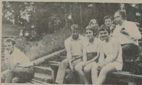
Turnierteilnehmer aus Freundesland - hier ungarische Gäste in Friedrichshagen!

- alle Staffelsechsten und Letzter der Staffelfünften.