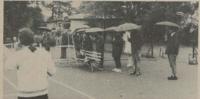
Die Berliner Klasseneinzelmeisterschaften begannen 1971 mit Regen - aber alle Unentwegten wurden schließlich belohnt. -- Für 1972 bitte nur Sonne beim Spiel!