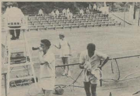
Jeder Seitenwechsel gewährt eine kleine Ruhepause - doch gleich geht es weiter !