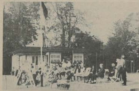
Ein großer Wunsch aller Aktiven und Organisatoren - noch mehr tennisbe- geisterte Zuschauer für 1972 !!!