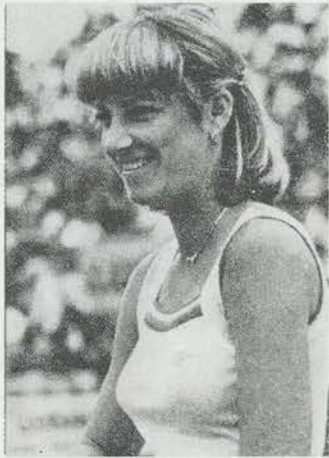
Von Erfolg zu Erfolg stürmte die erfahrene Amerikanerin Chris Lloyd-Evert in dieser Saison

Nach Wimbledon und ausgelassenem Davispokal trat Borg erstmalig wieder beim Stuttgarter Turnier an, daß der Veranstalter als „Europameisterschaft“ bezeichnete, obwohl außer Borg und Lendl die beiden stärksten Teilnehmer, nämlich McNamara und McNamee aus Australien kamen. Diese vier beherrschten dann auch die Szene. Borg schlug McNamee 6:1, 6:2, Lendl bezwang McNamara, der vorher seinen Landsmann Smid 6:4, 6:4 ausgeschaltet hatte, mit 6:2, 2:6, 6:4. Im Endspiel lag Borg schon 1:6, 2:4 zurück, ehe seine Schläge länger wurden und er noch 1:6, 7:6, 6:2, 6:4 gewann.