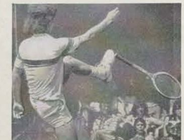
Zweimal McEnroe in Aktion: Oben versucht er sein Racket zu zerbrechen. Unten bekommt er einen Fußtritt.